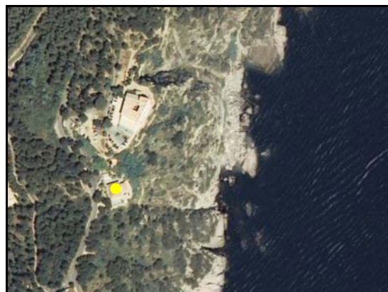
Señal de navegación – TIPO_0081: “/faro”